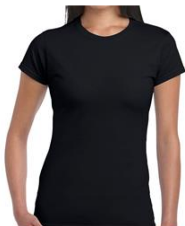
T-Shirt ajusté noir