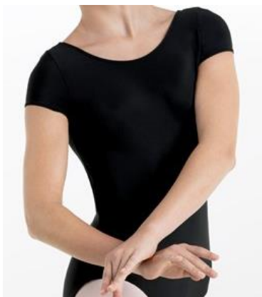
Léotard noir à manches