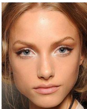
Maquillage de scène léger