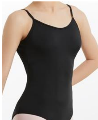
Léotard noir à bretelles