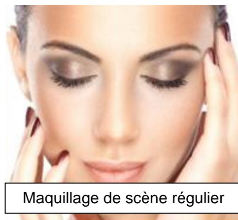
Maquillage de scène régulier

COIFFURE *S'assurer que les cheveux soient fixés et bien serrés sans cheveux dans le visage afin que celui-ci soit bien dégagé et que la coiffure tienne en dansant. Utiliser du fixatif et des épingles à cheveux au besoin. Si l'élastique est visible, celui-ci doit être noir ou brun. Pour toute autre question, veuillez-vous référer à l'enseignant.